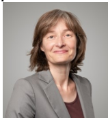
Cornelia Diethelm Shifting Society AG