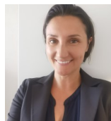
Eva Thelisson AI Transparency Institute