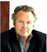
Professeur Mark Pieth Université de Bâle

Ethos organise une conférence-débat dans le but d'expliquer les enjeux éthiques, économiques et politiques auxquels font face les sociétés multinationales en matière de respect des droits humains, avec la participation des personnalités suivantes :